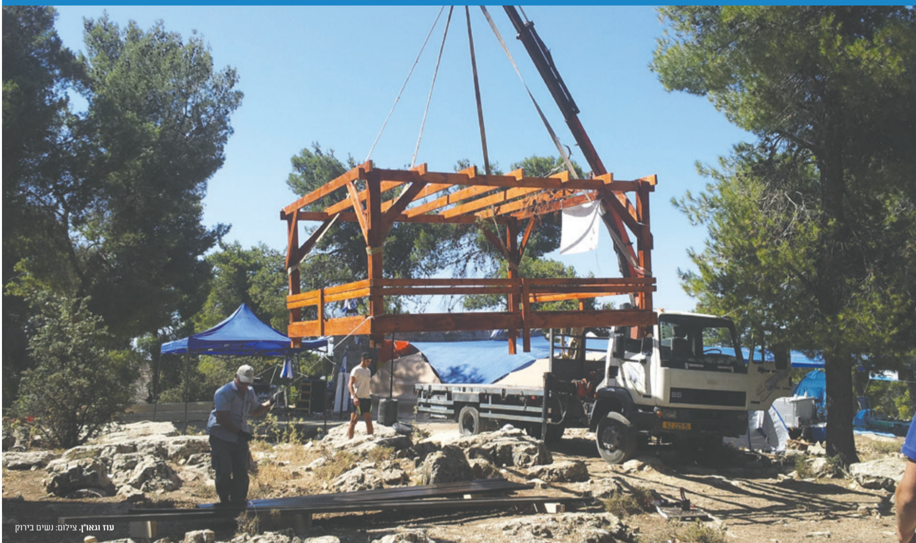
עוז וגאון.

את המקום, מנכשים, מנקים ומכשירים אותו כאתר מכובד וראוי בו יונצח זכרם של נכדו וחבריו החטופים שנרצחו. הסב הביע תקווה להתרחבותו של המקום כחלק מבניית ארץ ישראל בדרך לגאולה השלמה.