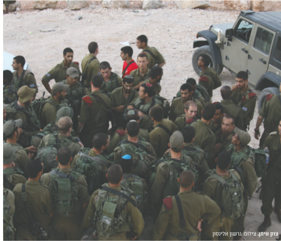
צוק איתן.

את דבריו מסכם פוגל בהמלצה לשנות את שמו של צה"ל לצבא התקפה לישראל, "אפילו את ראשי התיבות לא צריך לשנות לשם כך", הוא מעיר.