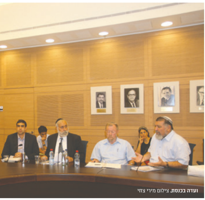
ועדה בכנסת.

חברת הכנסת סטרוק מדגישה כי הצעות החוק מנצלות גם את הרקע המדיני שהוכשר על ידי השמאל. "מבחינת הסברה אנחנו מקדמים את הכיוון שאומר שגם השמאל אומר שמה שהם מכנים כגושי התיישבות וודאי יישאר בריבונות ישראל בהסכם. אנחנו אומרים שאין הבל מזהות בין מה שהם מגדירים כגושים מה שאנחנו מכנים כגושים, כלומר כל האזור המיושב, כי מבחינה דמוגרפית אין משמעות ומבחינת התועלת יש כאן ערך גדול של יישובים שאנשים חיים בהם כבר שלושה וארבעה דורות מעבר לכך שמדובר באזורים שהם ערש התרבות היהודית".