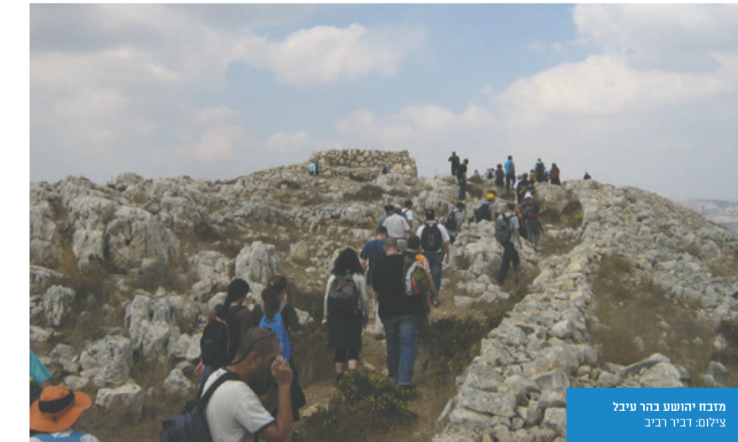
מוזבא יוהשע בהר עיבל

"בשילה שנחפרת מאוד לאחרונה נמצאו הרבה מאוד מטבעות עם הכתובות 'לגאולת ציון', 'לחירות ציון' ו'לחירות ירושלים'. במרד בר כוכבא היו מטבעות 'לחירות ישראל', 'שמעון נשיא ישראל' 'שמעון בר כוסבא נשיא ישראל' ועוד".