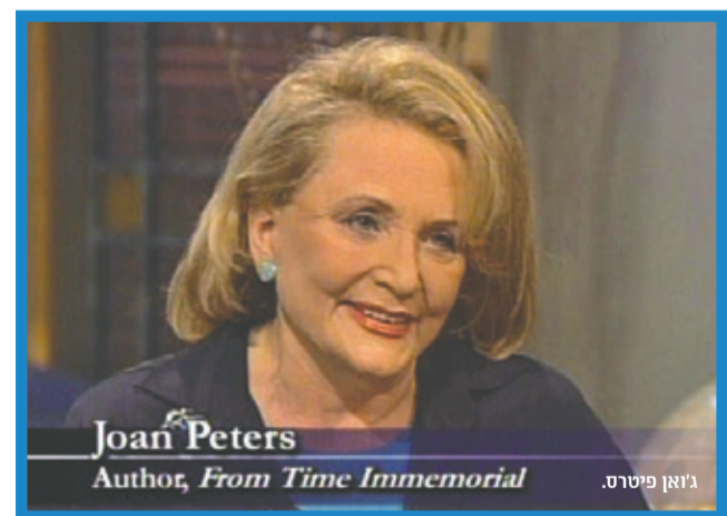
ג'ואן פיטרס. Author, From Time Immemorial

לדבריה "כל טענה באשר היא כלפי העם היהודי - כולל סוגיית יהודה ושומרון - הינה שקרית וחתרנית. האם כל קבוצה אחרת שתתבע את זכותה להיות עם - למשל, תביעתה של כנפיית באדר-מיינהוף שברלן וסביכותיה תוכרו כמדינת מיינהוף מאז ומקדם - האם גם אליה יש להתייחס ברצינות? רעיון "המדינה הפלסטינית" הוא נלעג לא פחות. יש כאן היסטוריה שקרית וטענות שקריות - המנסות לחקות את ההיסטוריה הלגיטימית והמוצדקת של העם היהודי".