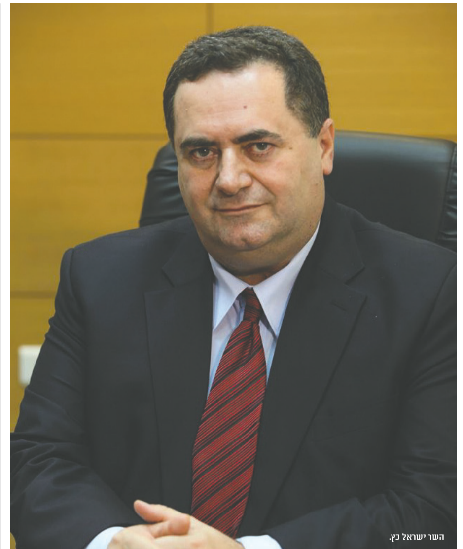
השר ישראל כץ

כל הניסיון ללכת לכיוון של מדינה פלשתינית מלכתחילה נועד לכישלון. אני מדבר על אוטונומיה עם זיקה אזרחית לירדן וסוג של זיקה פוליטית בעתיד לירדן, אוטונומיה שתאפשר להם לנהל את חייהם אבל ללא ענייני חוץ וביטחון