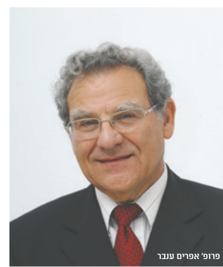
פרופ' אפרים ענבר

“הרעיון הפאן ערבי מכרסם במבנה המדינות הערבי צריך להיות מורכב מיחידה פוליטית אחת”