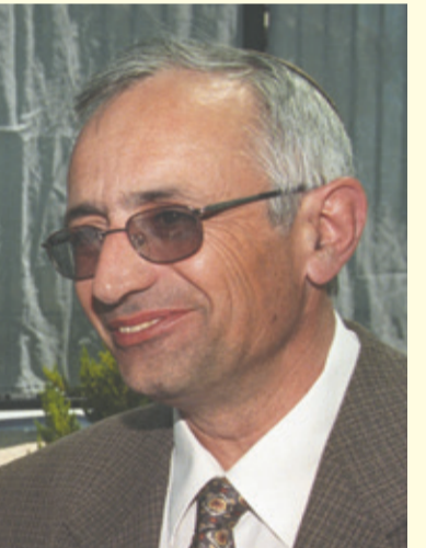
אורי אליצור ז"ל.

מדינה פלשתינית תמטיר גשם על קטיטיות על פתח-תקווה וגראדים על תל-אביב, תשתק מפעם לפעם את נתב"ג ותחזק את הכלכלה הישראלית. גנרלים בעלי קול עמוק יספרו לכם כאילו יש לצה"ל מענה על זה. אבל אין לו. רק לפני שנה הכניסו מחבלים מעזה את כל תושבי הדרום למקלטים, וכך הם יכניסו גם את תושבי גוש דן ויחזקו את המדינה. במקום להקשיב לקולות העמוקים המרגיעים של הגנרלים שמרמים את עצמם, תקשיבו להיגיון הפרטי שלכם. סעו פעם לצומת רנתים, רבע שעה נסיעה מכביש שהם-ראש-העין. משם אפשר בקלי קלות להפיל מטוס נוסעים שנמצא בדרכו לנחיתה בנתב"ג. אפשר לעשות את זה באמצעות טיל שהוא והמשגר שלו יחד נכנסים לתוך בגאוו של סובארו משפחתית, או לשק צד של אוסף חמור. סעו רבע שעה מזרחה ותרוא את זה. ואתם יודעים איך זה: אם זה אפשרי זה יקרה. ונסו לשער מה יקרה לתיירות לישראל, ולכלכלה הישראלית, יום אחרי שמטוס כזה יופל על מאות נוסעיו ומטענו.