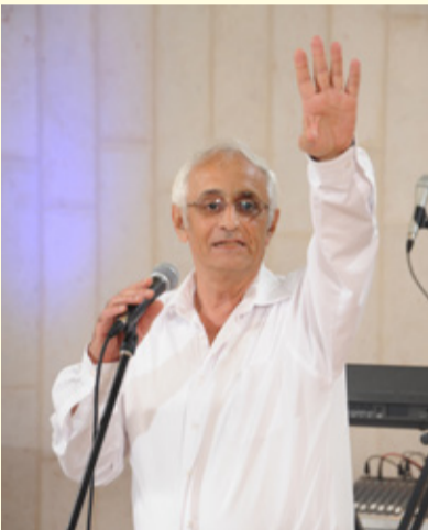
(מקור ראשון ו' תמוז תשע"ג)

תשאלו את הסבא-רבא שלכם, שכבר מת, ואת הנין שלכם שעוד לא נולד, ושניהם