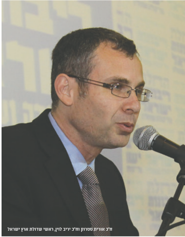
ח"כ אורית סטרוק וח"כ יריב לוין, ראשי שדולת ארץ ישראל

בעוד רבים מדברים, מכריזים ומצהירים הצהרות, על שולחן הכנסת כבר מוכנים עשרה חוקי ריבונות הנוגעים לעשרה אזורים שונים ביהודה ושומרון. מאחורי המהלך עומדים צמד ראשי השדולה למטן ארץ ישראל, חברי הכנסת אורית סטרוק ויריב לוין. האם אנחנו מתקרבים למימוש המהלך?