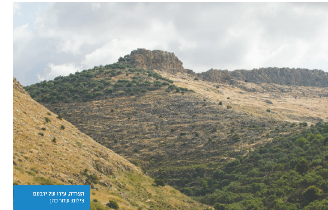
הצדה, עירו של יבנעם

גנבי עתיקות ערבים לא בוחלים באמצעים ולא חוששים מכלום. הם מגיעים לכל מקום, חופרים, מוצאים, גונבים ומוכרים עתיקות, לרוב בשוק השחור הפורח. ריבונות והחלת החוק הישראלי על השטח תעביר את האחריות לבלימת התופעה לרשות העתיקות. עתירת המשאבים והפקחים.