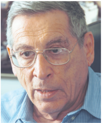
רחבעם זאבי (גנדי).

"ההונאה הגדולה בהיסטוריה הולכת ונבנית מולנו, זו ההונאה העולמית הקובעת שהיהודי הוא עולה חדש והערבי ישב כאן מקדמא דנא. אין נבלה גדולה מהעיוות הזה."