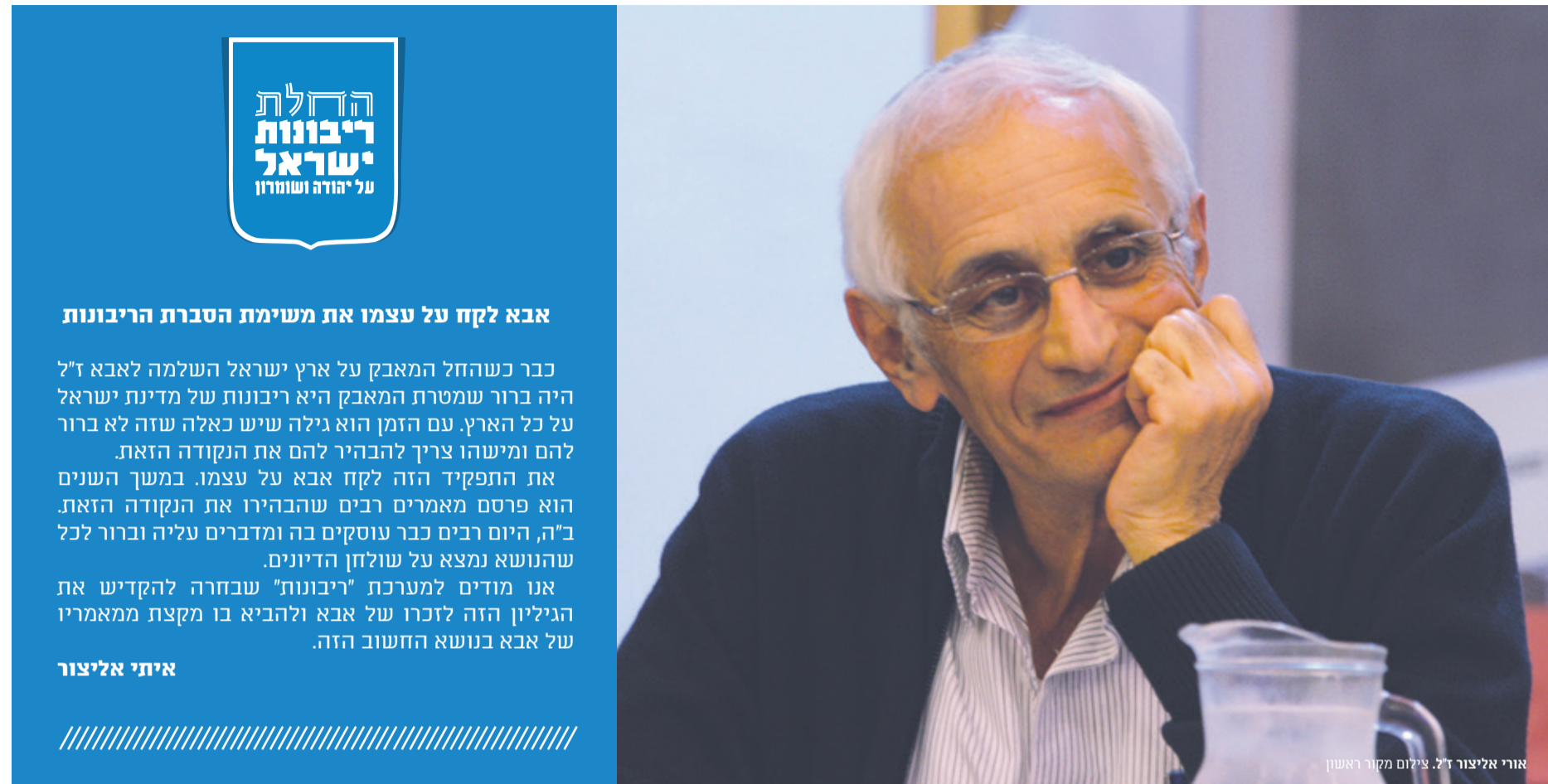
אורי אליצור ד"ר.

6 / ח"כ אוריית טרונק הריבונות בדרך. על השולחן החוקים כבר