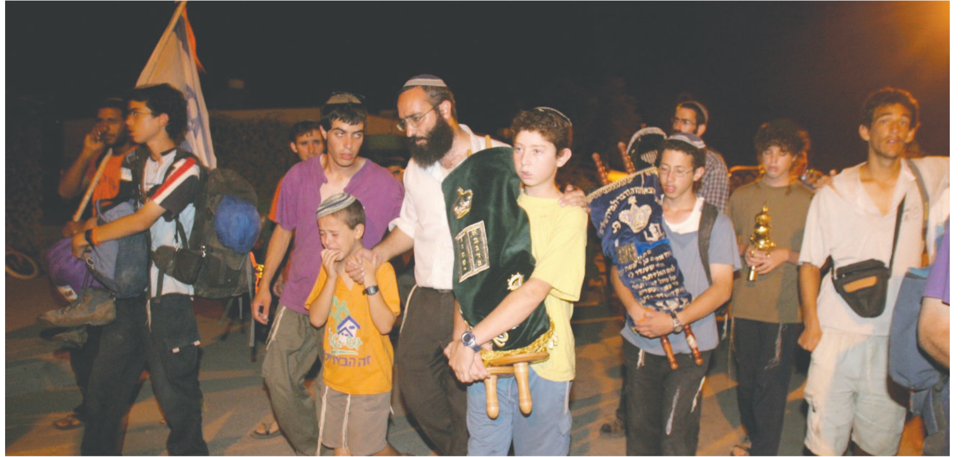
הנירוש מגוש קטיף - אחת ממצבות אסון הסכמי אוסלו.